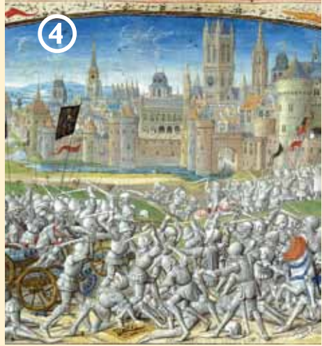
Miniatuur met de slag op het Beverhoutsveld

Gent en Brugge zijn in de middeleeuwen de twee machtigste steden van Vlaanderen. Ze staan mekaar vaak naar het leven. In 1382 haalt Gent zwaar uit: de Gentenaars verpletteren de Brugse milities op het Beverhoutsveld en daarna wordt de stad geplunderd.