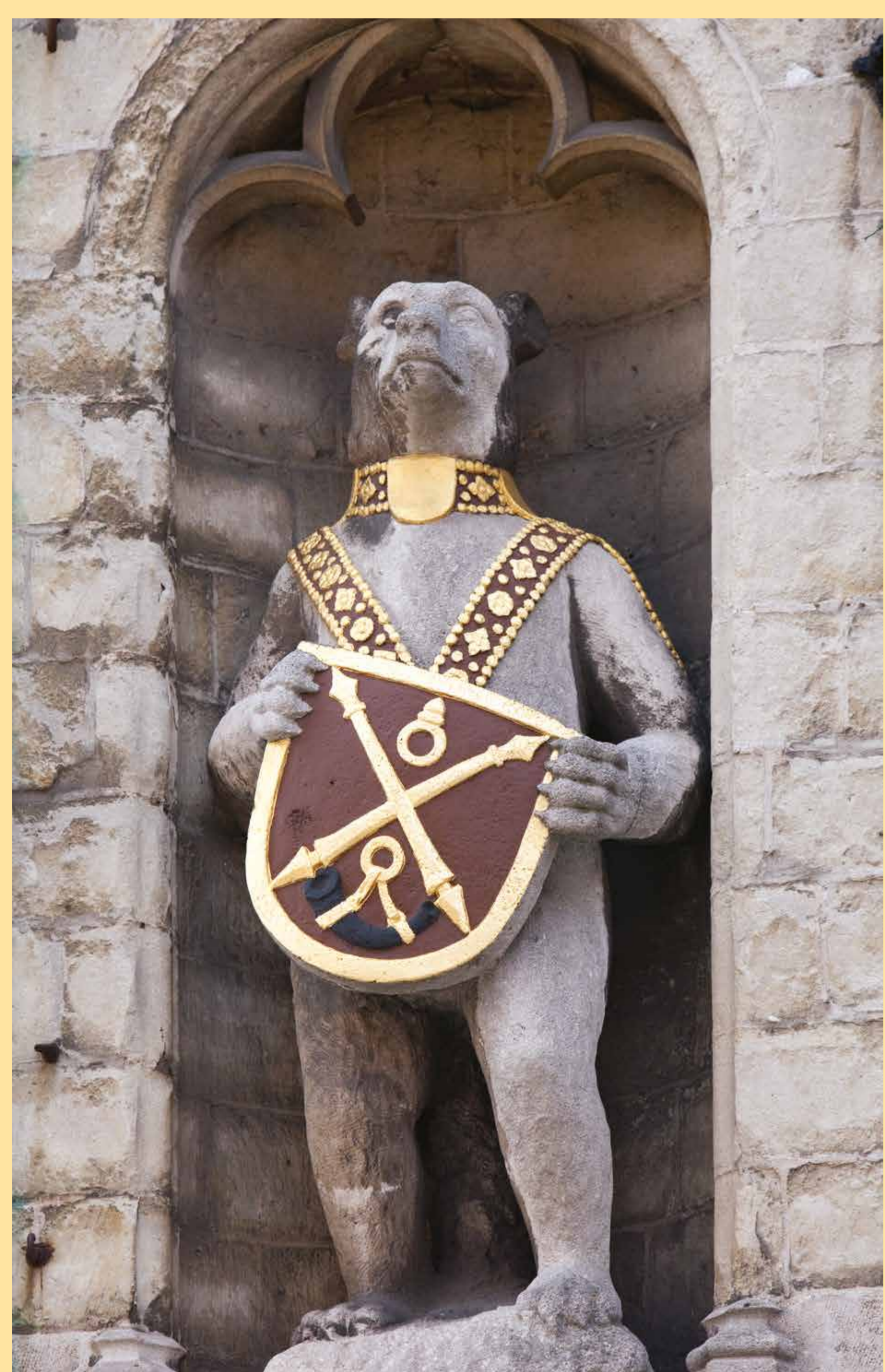
Het Beertje van de Poortersloge verwijst naar de beer die volgens de overlevering de oudste bewoner van de stad is.