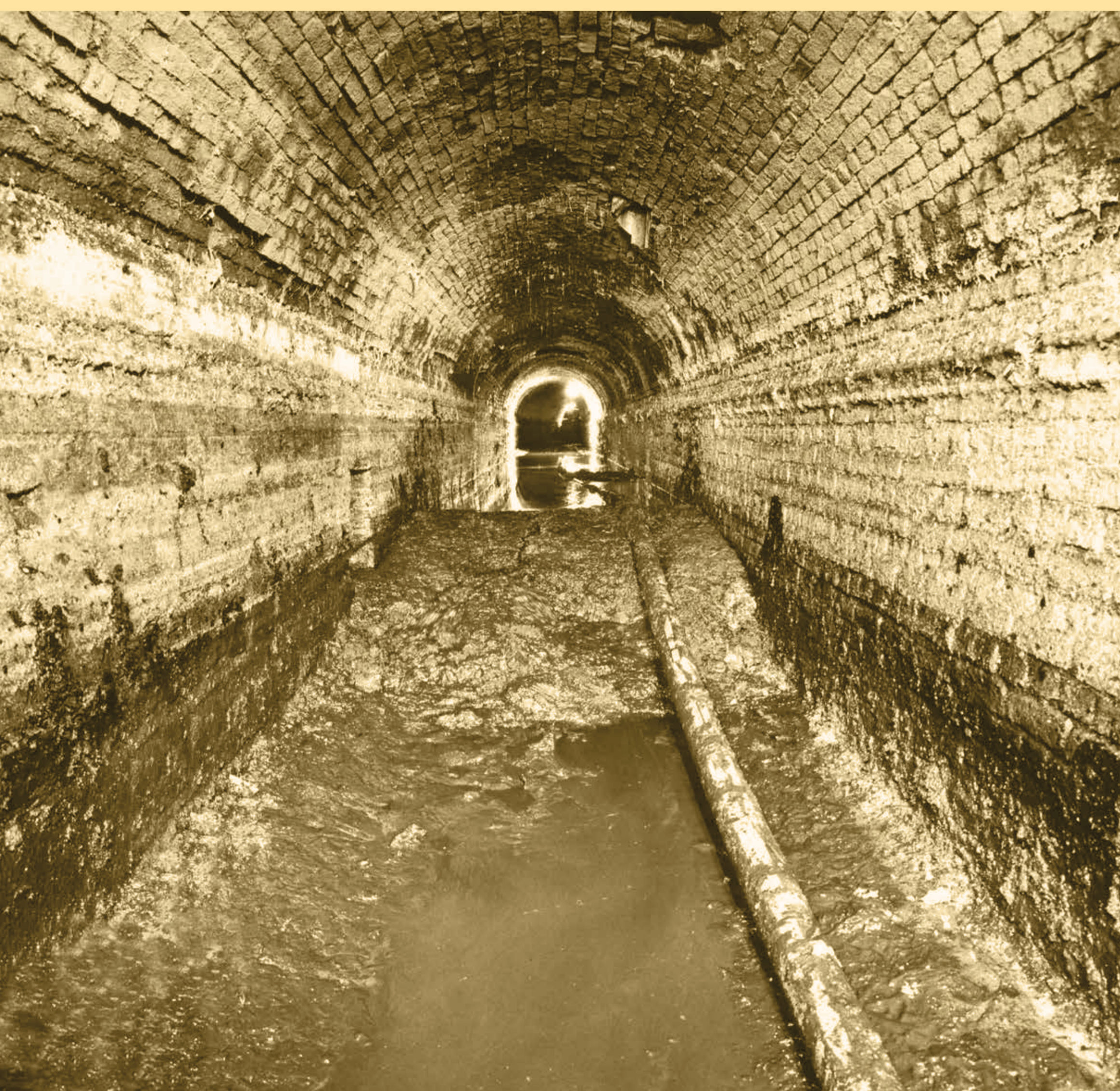
In de late 18de en 19de eeuw wordt een deel van de Brugse Reien overwelfd.

De Rode Steen krijgt in 1877 als eerste gebouwen in Brugge een 'kunstige herstelling' (herstelling met stadssubsidie).