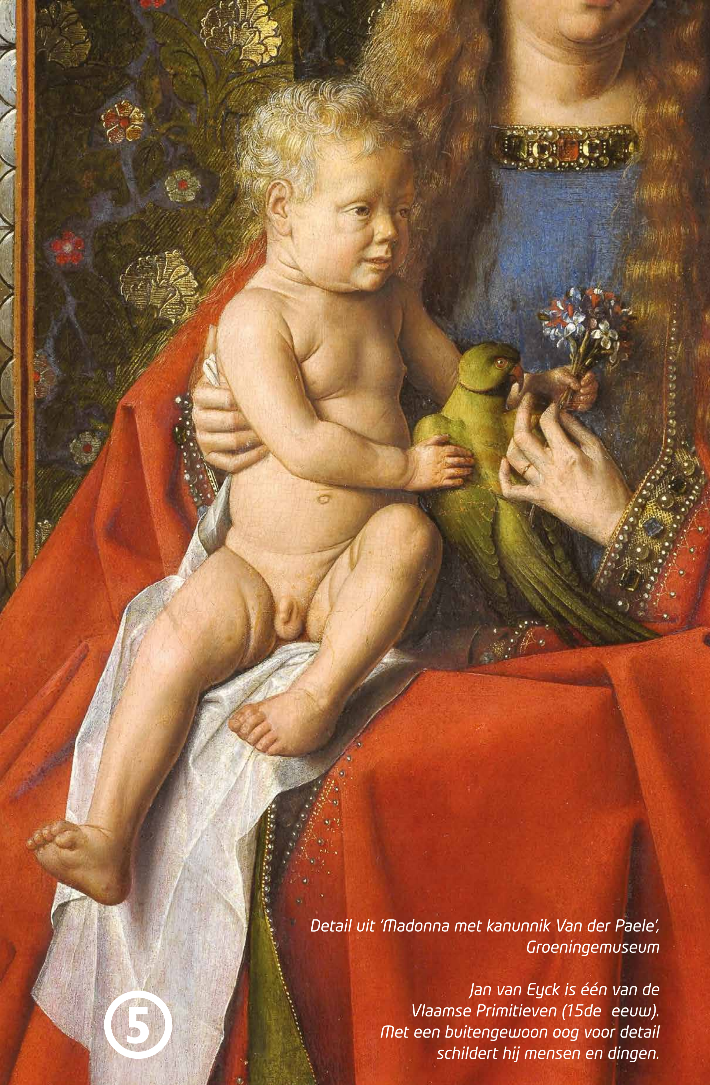
Detail uit 'Madonna met kanunnik Van der Paele', Groeningemuseum

Dit deel van de stad ontwikkelt zich vanaf 1200. Rond het water van de Brugse Reien groeit er dan een bloeiende haven. Het huidige plein komt er pas eeuwen later; in de 18de eeuw wordt een deel van de Reien immers overwelfd. Onder onze voeten stroomt het water ook vandaag nog door. In de 19de eeuw worden verschillende huizen op en rond het plein gerestaureerd.