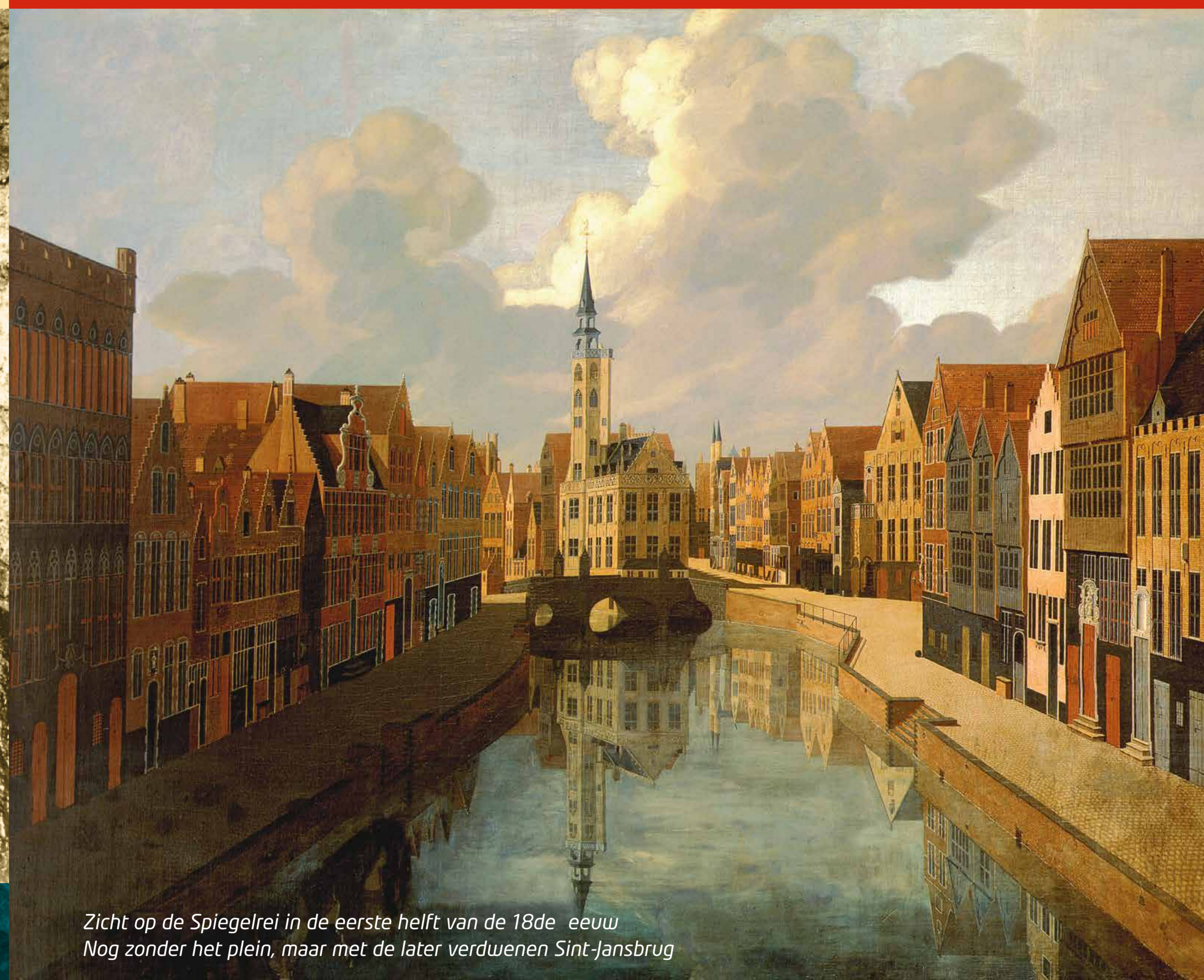
Zicht op de Spiegelrei in de eerste helft van de 18de eeuw. Nog zonder het plein, maar met de later verdwenen Sint-Jansbrug.