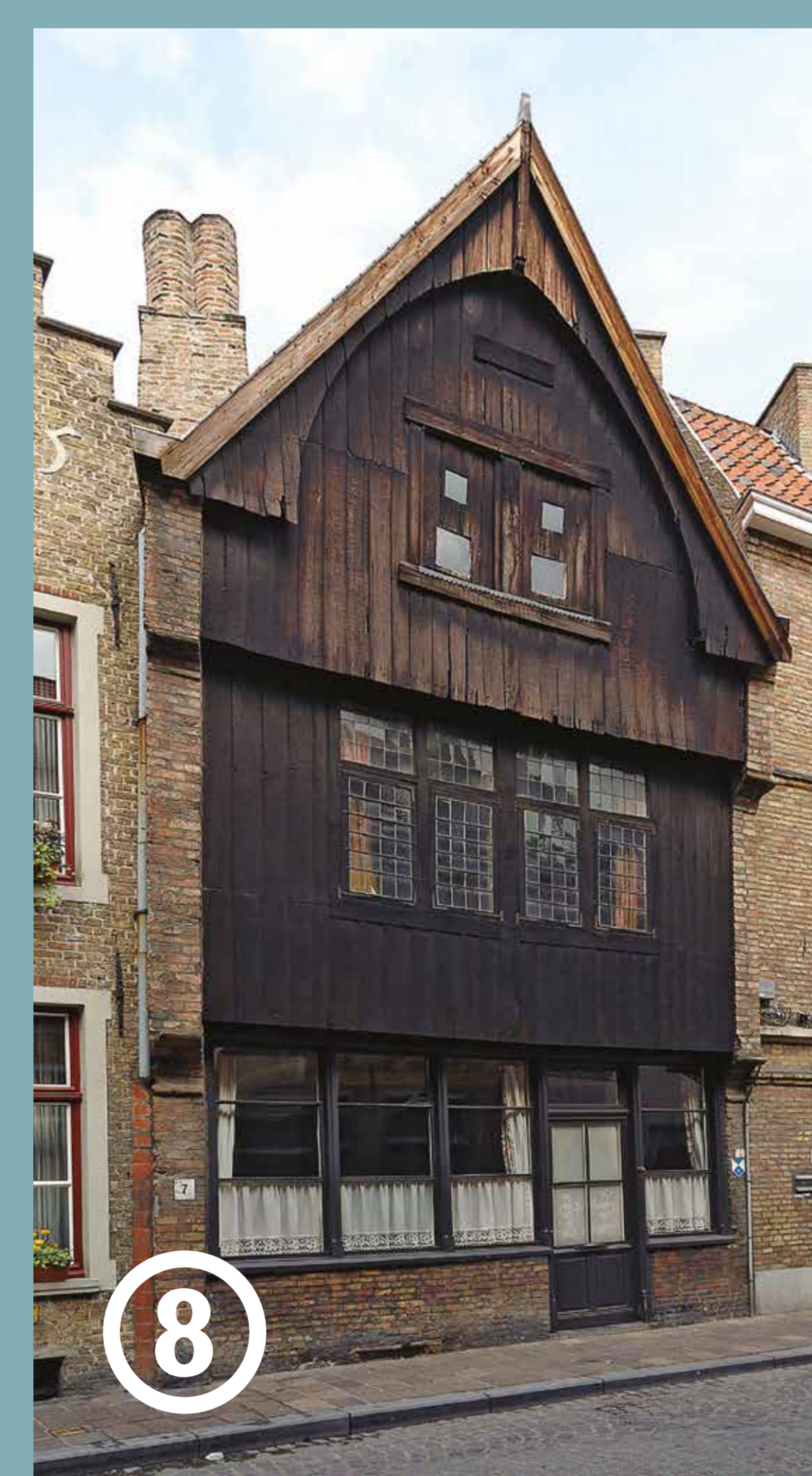
Huis met houten gevel in het Genthof, richting Woensdagmarkt. Dit is één van de twee authentieke houten gevels in de stad. Vanaf de 17de eeuw worden die geweeerd en afgebroken wegens brandgevaar.