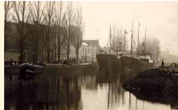
Zicht op de haringkerij Van den Abeele, 1911

In de 19de en de eerste helft van de 20ste eeuw is de Coupure de aanlegplaats van een aantal beurtschepen. Dit zijn binnenvaartuigen die eenmaal per week of tweewekelijks een koerierdienst verzekerden naar een bepaalde bestemming. Iedereen kan tegen betaling een pakje of een grotere hoeveelheid goederen meegeven.