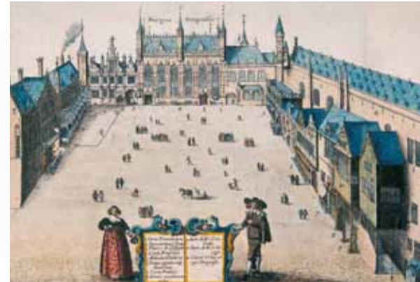
Zicht op de Burg in de zeventiende eeuw