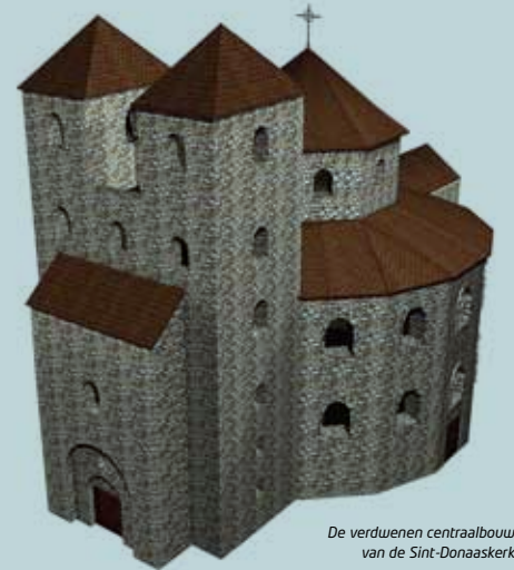
De verdwenen centraalbouw van de Sint-Donaaskerk

Op de oorspronkelijke plek van de kerk staat van 2002, het jaar waarin Brugge Culturele Hoofdstad van Europa is, tot 2013 een eigentijds en omstrepen paviljoen van de Japanse architect Toyo Ito.