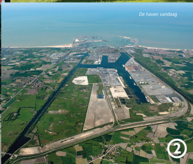
De haven vandaag