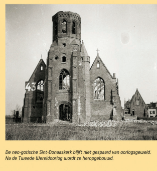
De neo-gotische Sint-Onaaskerk blijft niet gespaard van oorlogsgeweld. Na de Tweede Wereldoorlog wordt ze heropgebouwd.