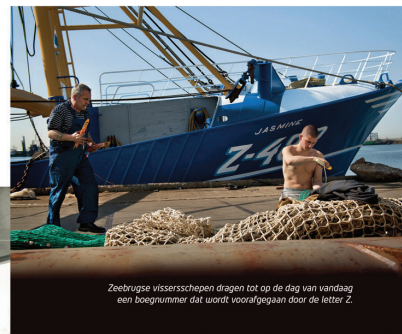
Zeebrugge vissersschepen dragen tot op de dag van vandaag een boegnummer dat wordt voorafgaan door de letter Z.

Tot ver in de 19de eeuw is er op de plaats van het huidige Zeebrugge alleen strand, duin en polder. Daarna verandert het landschap in snel tempo. De Bruggelingen hebben immers een droom: de aanleg van een nieuwe zeehaven moet Brugge opnieuw de welvaart brengen die de stad in de late middeleeuwen kende dankzij het Zwin.