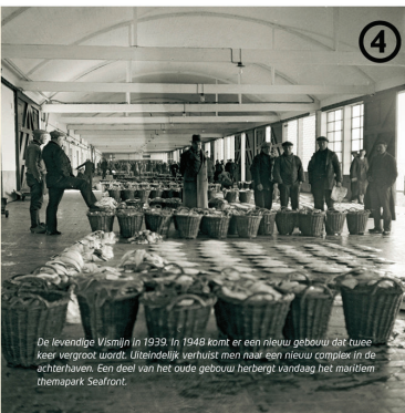
4 De levendige Vismijn in 1939. In 1948 komt er een nieuw gebouw dat twee keer vergroot wordt. Uiteindelijk verhuist men naar een nieuw complex in de achterhaven. Een deel van het oude gebouw herbergt vandaag het maritiem themapark Sealpoint.

De naam 'Zeebrugge' wordt voor het eerst vermeld in 1899. De nederzetting dankt haar bestaan aan de haven. Door die sterke verwevenheid met de haven en het net van water-, land- en spoorwegen, bestaat Zeebrugge uit verschillende wijken. Wij staan in Zeebrugge-Dorp bij de Oude Vismijn. Door de sterke uitbreiding van de haven in de laatste tientallen jaren en de toekomstige aanleg van een nieuwe zeelus is de werkgelegenheid maar staat de woonomgeving onder druk.