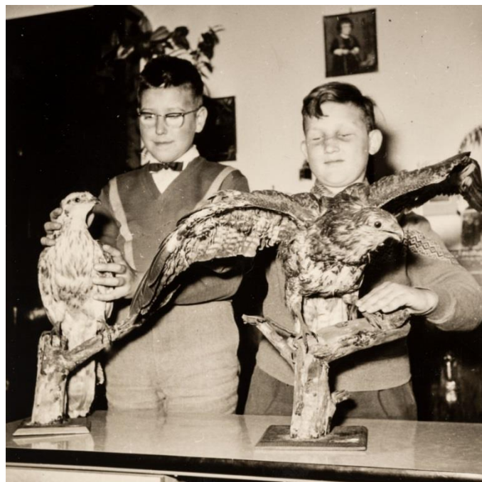
Afbeelding 1: Uit de oude doos, leerlingen met twee opgezette vogels in Spermalie, Brugge

In februari 2018 werd een basisregistratie van de hulpmiddelen door vrijwilligers afgerond en online beschikbaar gesteld op www.erfgoedinzicht.be en www.erfgoedbrugge.be . Opleiding en begeleiding hierbij werden voorzien door depotconsulenten (toen Provincie West-Vlaanderen, vandaag Vlaanderen). Er is sindsdien een gestandaardiseerde inventaris van alle objecten in deze collectie hulpmiddelen in Adlib software beschikbaar, gedocumenteerd met verzorgd fotomateriaal. Dit was een goede basis om een waarderingstraject te starten. Gezien de gespecialiseerde materie en het belang van participatie in dit verhaal, werd er voor geopteerd dit traject te beperken tot de hulpmiddelen voor mensen met een visuele beperking.