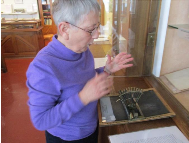
Afbeelding 3: Plaatsbezoek aan het Musée Valentin Haüy, Parijs