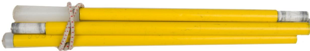
B108, een gele blindenstok