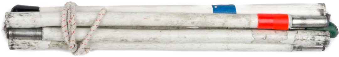
B109, een witte blindenstok