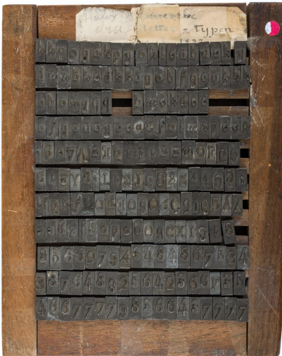
B004, druklettertypes Valentin Haüy