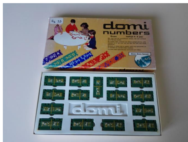
Afbeelding 6: Gezelschapsspel uit de collectie Ganspoel, Huldenberg

Een ietwat ontnuchterende vaststelling (die trouwens ook tijdens de evaluatie aan bod kwam) is dat de registratie en ontsluiting van de collectie nog niet toegankelijk is voor de heel belangrijke doelgroep van mensen met een visuele beperking zelf. In plaats van 5 filmpjes te maken, werd dan ook geopteerd om één filmpje te maken rond het gebruik van de raphygraaf, een topstuk uit de collectie met een bijzonder mooie geschiedenis. De werking van de raphygraaf wordt toegelicht door een vrijwilligster van het Musée Valentin Haüy in Parijs, zij doet dit aan de hand van een quasi identiek toestel uit haar eigen collectie dat ooit aan haar vader toebehoorde. Vertaling, ondertiteling en audiodescriptie zijn voorzien. De raphygraaf had tot doel een geschreven taal die zowel voor mensen met als zonder visuele beperking leesbaar is. De symbolische waarde hiervan is groot. De opnames gebeurden op 21 september 2019 in Spermalie, afwerking van het filmpje in de daaropvolgende weken. Het Musée Valentin Haüy toont interesse om het filmpje ook te gebruiken.