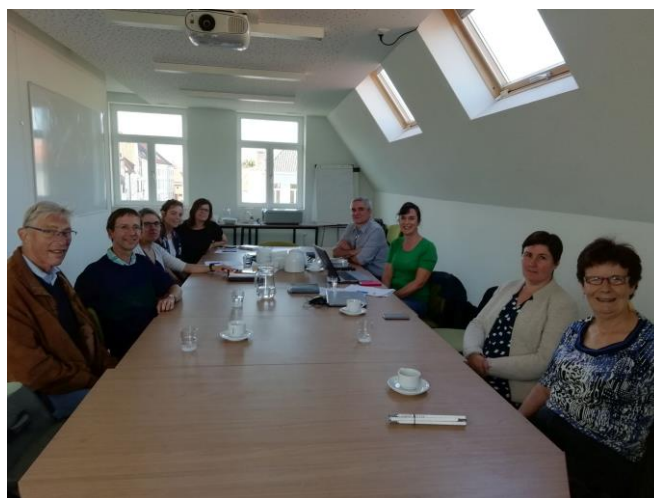
Afbeelding 2: Bijeenkomst met klankbordgroep en kernteam