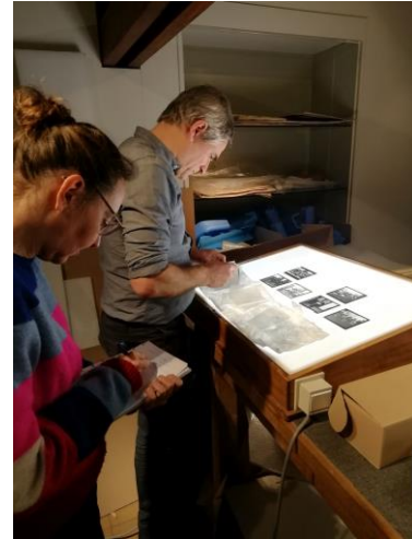
Afbeelding 4: Plaatsbezoek aan het Museum Dr. Guislain, Gent

Alle aanvullende informatie werd ingevoerd in Adlib en is al enkele maanden toegankelijk via www.erfgoedinzicht.be en www.erfgoedbrugge.be . Twee objecten die tijdens de basisregistratie de dans ontsprongen waren, werden alsnog geregistreerd en gefotografeerd.