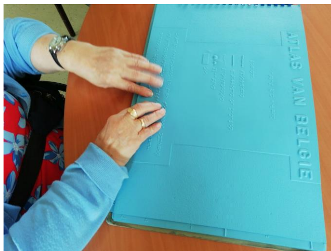
Afbeelding 5: Op verhaal bij de bewoners van 'Huis 45', Varsenare

Parallel met het hierboven beschreven verhaal werd ook naar de perceptie van de hulpmiddelen gepeild bij ervaringsdeskundigen van verschillende generaties. Verschillende hulpmiddelen werden hiertoe door de trajectbegeleiders in een klas (leerlingen 7 de jaar middelbaar Spermalie) en in 'Huis 45' (bewoners, Licht en Liefde, Varsenare) gepresenteerd, telkens in een vertrouwde omgeving (met aanwezigheid leerkracht of begeleider). Namen van deelnemers aan deze bijeenkomsten zijn terug te vinden de waarderingstabel onder het tabblad 'bronnen'. Omwille van privacy worden ze niet opgenomen in dit rapport. Er werden verslagen/opnames gemaakt/geregistreerd van al deze bijeenkomsten.