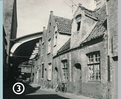
De Jeruzalemkapel (vijftiende eeuw), foto begin twintigste eeuw