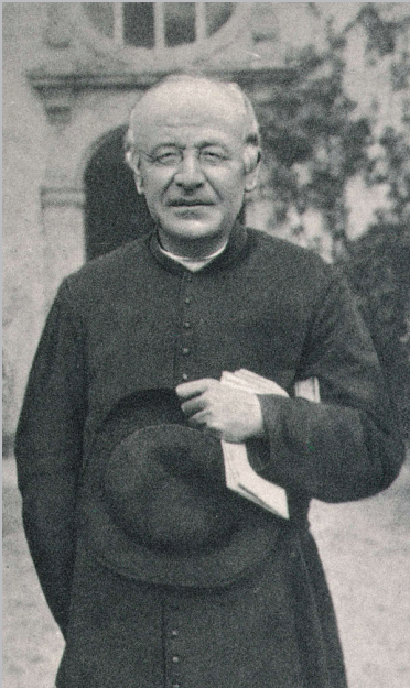
De Vlaamse dichter Guido Gezelle, eind negentiende eeuw

Het hoveniersland is in het tweede kuart van de twintigste eeuw verkaveld. In de plaats komen burgershuizen. Ondermeer daardoor verdwijnt het proletarisch karakter van de wijk.