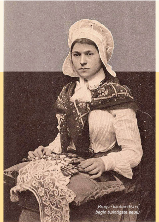
Brugse kantwerkster, begin twintigste eeuw