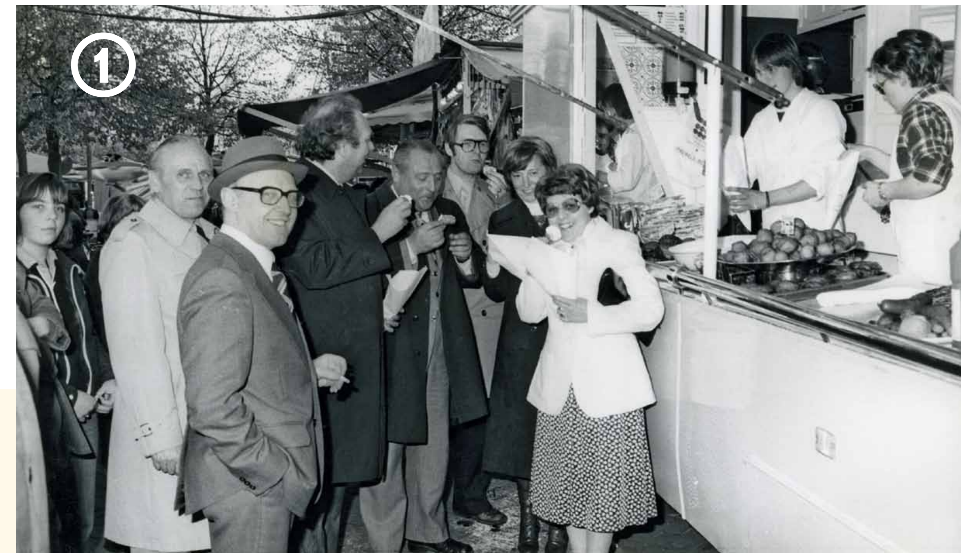
De Meifoor op 't Zand, tweede helft 20ste eeuw

't Zand wordt al in 1127 in een tekst vermeld als 'Harena'. Dit Latijnse woord voor 'zand' verklaart meteen de naam van het plein. Het is dan immers een grote zandige vlakte net buiten de stad. Bij speciale gebeurtenissen komt de hele Brugse bevolking er samen.