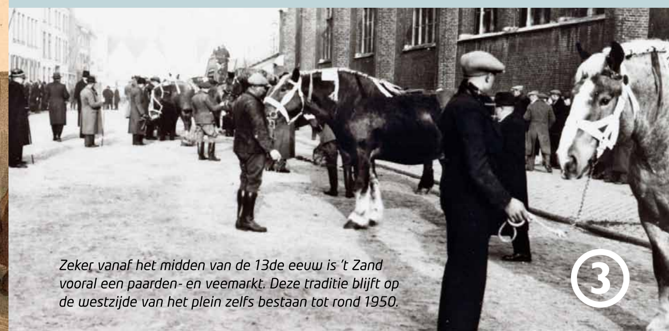
Zeker vanaf het midden van de 13de eeuw is 't Zand vooraf een paarden- en veemarkt. Deze traditie blijft op de westzijde van het plein zelfs bestaan tot rond 1950.

Op 't Zand worden de sporen uitgeboken en het tweede station wordt in 1947 gesloopt. Na ruim een eeuw is er zo opnieuw sprake van een volwaardig plein. Rond 1980 maken een tunnel en een ondergrondse parkeergarage 't Zand bovendien grotendeels verkeersvrij. Ook de grote centrale fontein met beelden dateert uit die tijd.