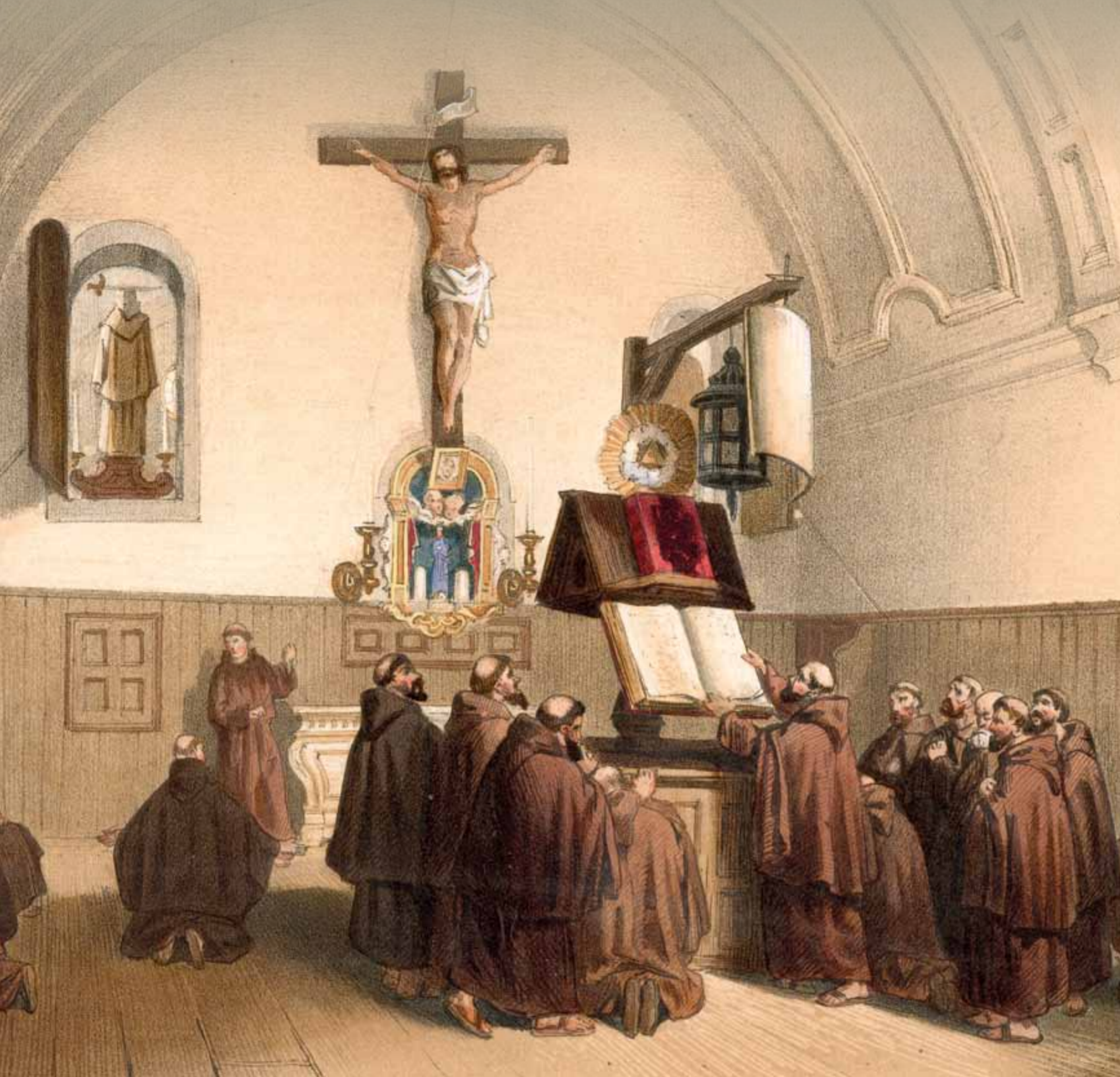
In 1620 wordt aan de zuidzijde van 't Zand een kapucijnenklooster gebouwd. Het verdwijnt wanneer men in de 19de eeuw de bouw van het tweede station en de uitbreiding van de sporen aanvat.