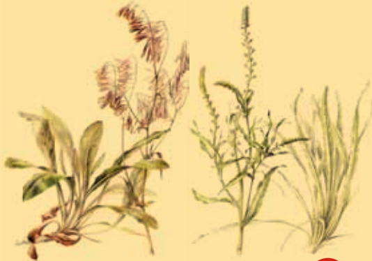
Planten geven kleur aan het middeleeuuse laken.

In de 17de eeuw worden de ververs verdreven door de jezuïeten. Archeologisch onderzoek van hun voormalige klooster (Verversdijk 16) leert ons veel over het leven van zowel ververs als paters. Na de opheffing van de jezuïetenorde wordt het gebouw nog gebruikt als kazerne en school. Vandaag is hier een campus van het Europacollege gevestigd.