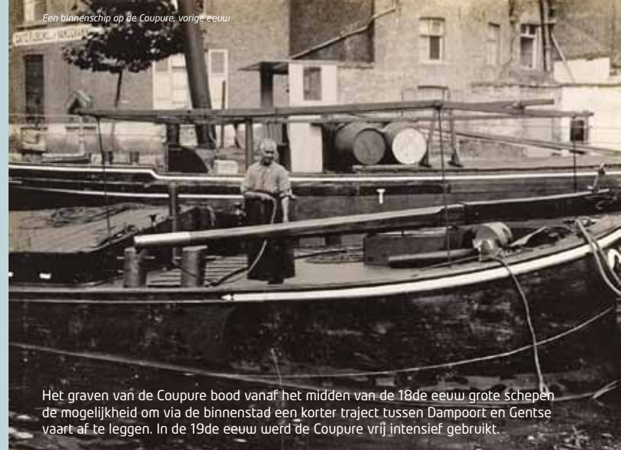
Een binnenschip op de Coupure, vorige eeuw

Het graven van de Coupure bood vanaf het midden van de 18de eeuw grote schepen de mogelijkheid om via de binnenstad een korter traject tussen Dampoort en Gentse vaart af te leggen. In de 19de eeuw werd de Coupure vrij intensief gebruikt.