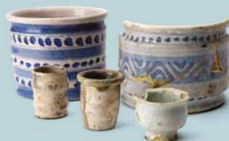
19de-eeuwse zelfpotten, gevonden bij opgravingen op de Verversdijk

In de 18de eeuw ondergaat het een grote verbouwing. Later staat het in Brugge bekend als het RTT gebouw. Na vele jaren leegstand wordt het gebouw nu een hotel (Hoogstraat 8).