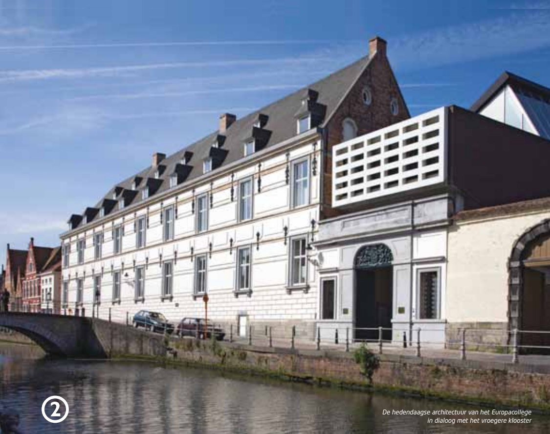
De hedendaagse architectuur van het Europacollege in dialoog met het vroegere klooster