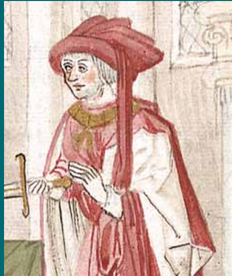
Adolf van Kleeef (15de eeuw), ridder van het Gulden Vlies en heer van Ravenstein