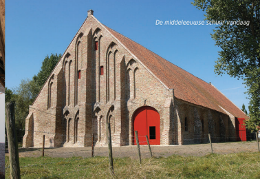
De middeleeuwse schuur van Ter Doest