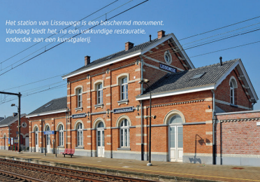
Het station van Lissewege is een beschermd monument. Vandaag biedt het een eekvakondige restauratie, onderdak aan een kunstgalerie.