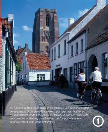
De typische witte huisjes staan in de schaduw van de monumentale, vroeggotische Onze-Lieve-Vrouwkerk met haar massieve toren. De kerk dateert uit de 13de eeuw. Lissewege is dan een stopplaats voor pelgrims onderweg naar Santiago de Compostela en een bevoorwaartsoord voor Maria vereerders.