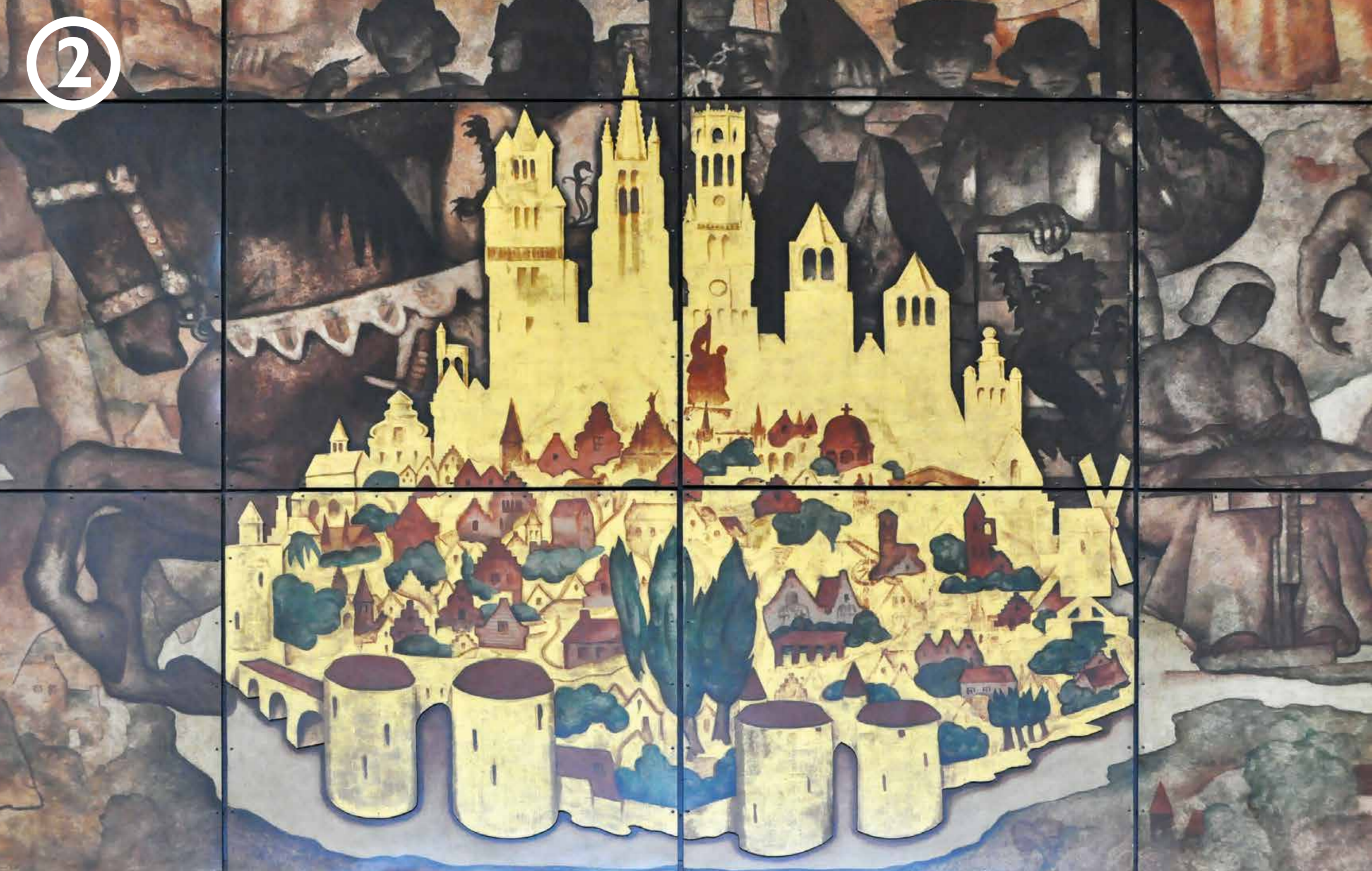
Brugge staat centraal op het middenpaneel.

Net als in andere centrumsteden wordt de buurt van het station recent sterk ontwikkeld met appartementsgebouwen, hotels, kantoren, winkels en parkeervoorzieningen. "Project Nieuwe Brugge" zal pas binnen enkele jaren afgerond zijn.