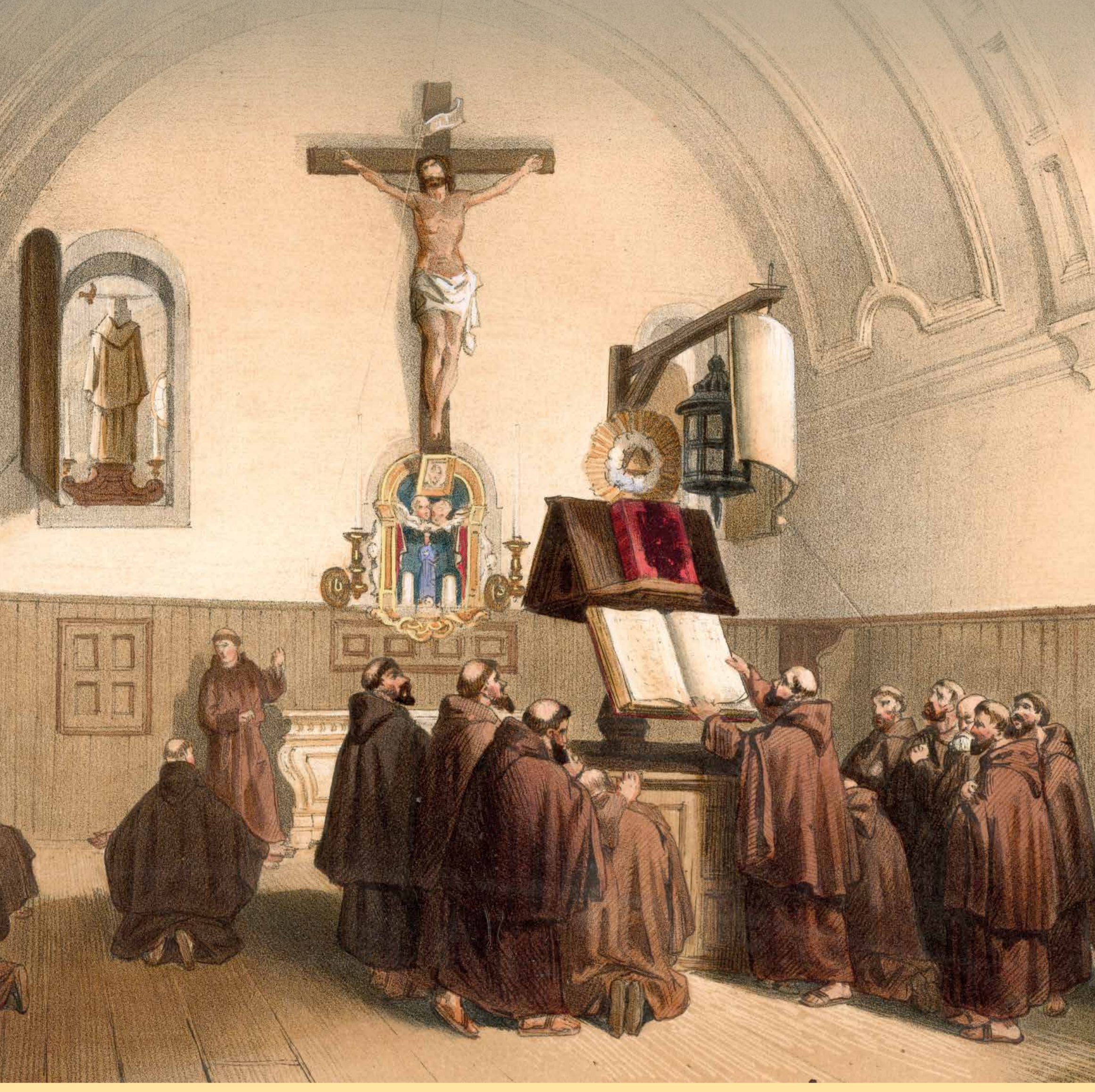
In 1620 wordt aan de zuidzijde van 't Zand een kapucijnenklooster gebouwd. Het verdwijnt wanneer men in de 19de eeuw de bouw van het tweede station en de uitbreiding van de sporen aanvat.