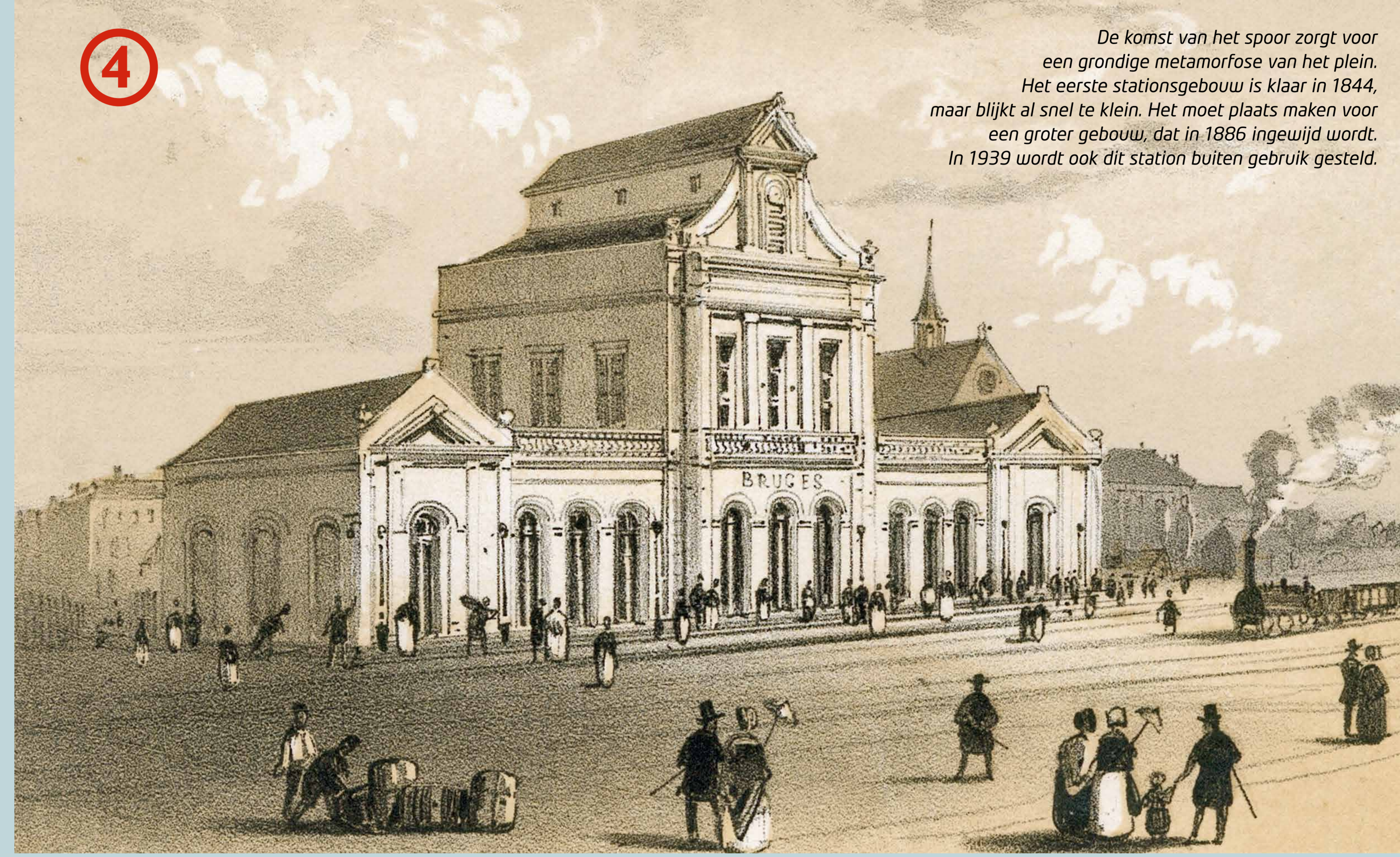
De komst van het spoor zorgt voor een grondige metamorfose van het plein. Het eerste stationsgebouw is klaar in 1844, maar blijkt al snel te klein. Het moet plaats maken voor een groter gebouw, dat in 1886 ingewijd wordt. In 1939 wordt ook dit station buiten gebruik gesteld.

In 1128 wordt op 't Zand een gracht gegraven als onderdeel van een eerste stadswaailing. De gracht loopt dan waar nu het voetpad is, tussen de cafeterrassen en de gebouwtjes van de ondergrondse parkeergarage. Bij het begin van de Noordzandstraat en de Zuidzandstraat verrijzen de Noord- en Zuidzandpoort. Beide stadspoorten zijn intussen al lang verdwenen maar de gracht is er nog, ondergronds. Hij wordt in de 19de eeuw overwelfd om een stationsplein aan te leggen.