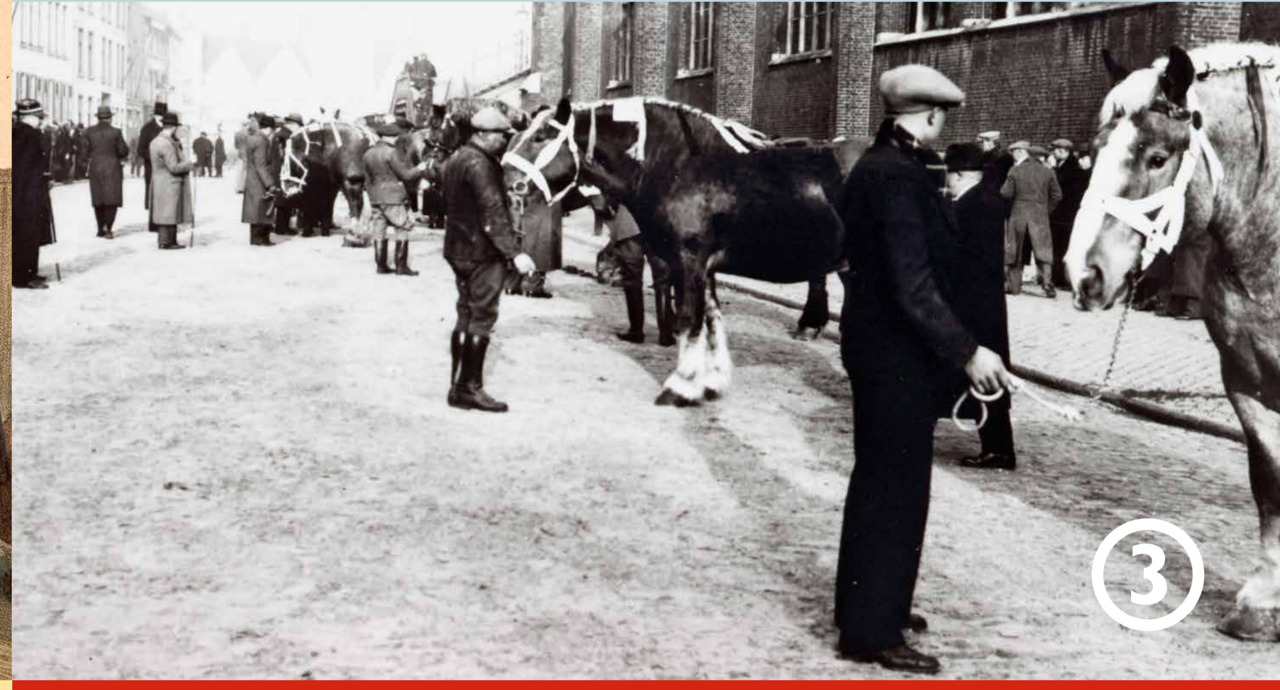
Zeker vanaf het midden van de 13de eeuw is 't Zand vooral een paarden- en veemarkt. Deze traditie blijft op de westzijde van het plein zelfs bestaan tot rond 1950.

Op 't Zand worden de sporen uitgeboken en het tweede station wordt in 1947 gesloopt. Na ruim een eeuw is er zo opnieuw sprake van een volwaardig plein. Rond 1980 maken een tunnel en een ondergrondse parkeergarage 't Zand bovendien grotendeels verkeersvrij. Ook de grote centrale fontein met beelden dateert uit die tijd.