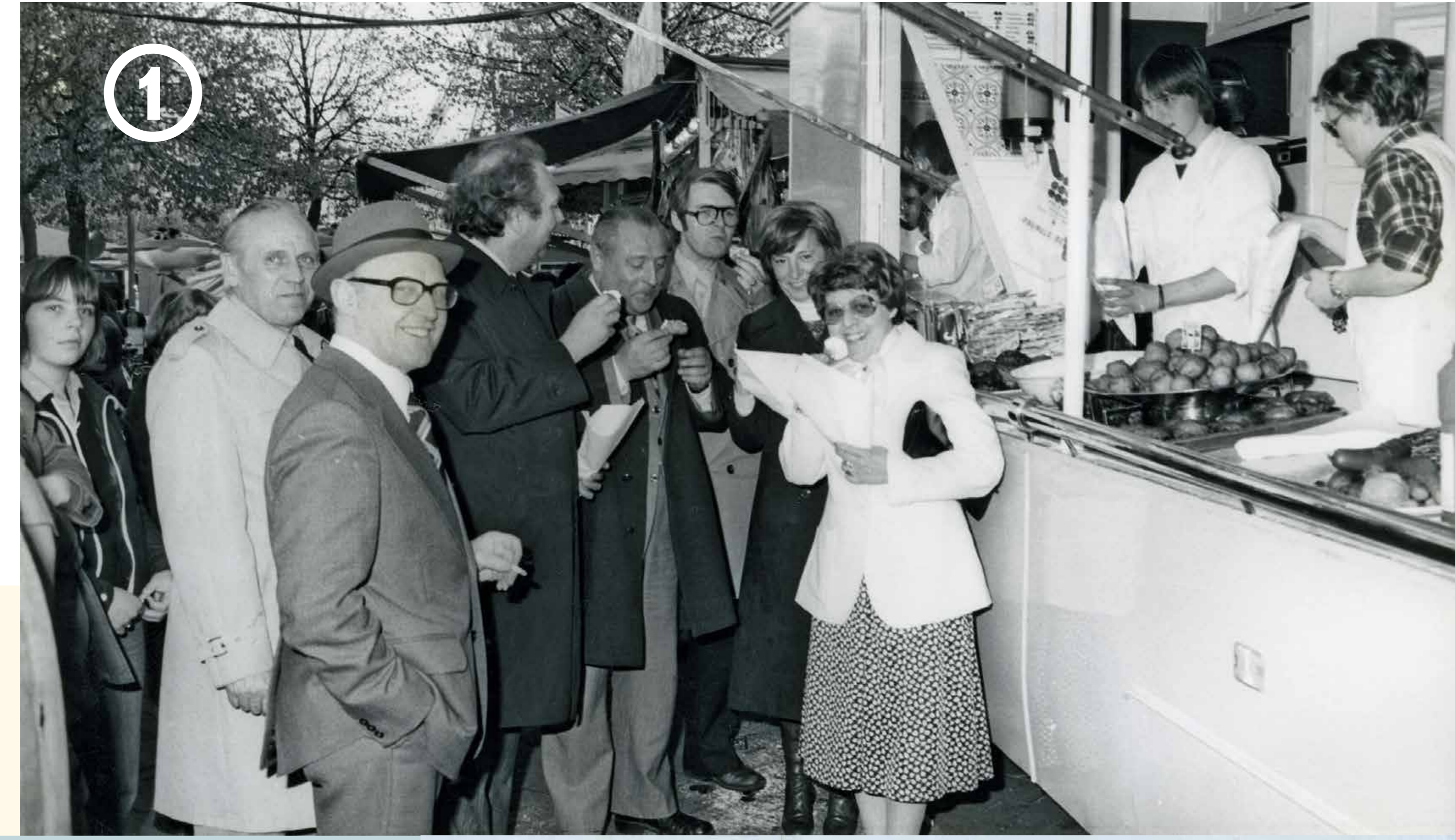
De Meifoor op 't Zand, tweede helft 20ste eeuw

't Zand wordt al in 1127 in een tekst vermeld als 'Harena'. Dit Latijnse woord voor 'zand' verklaart meteen de naam van het plein. Het is dan immers een grote zandige vlakte net buiten de stad. Bij speciale gebeurtenissen komt de hele Brugse bevolking er samen.