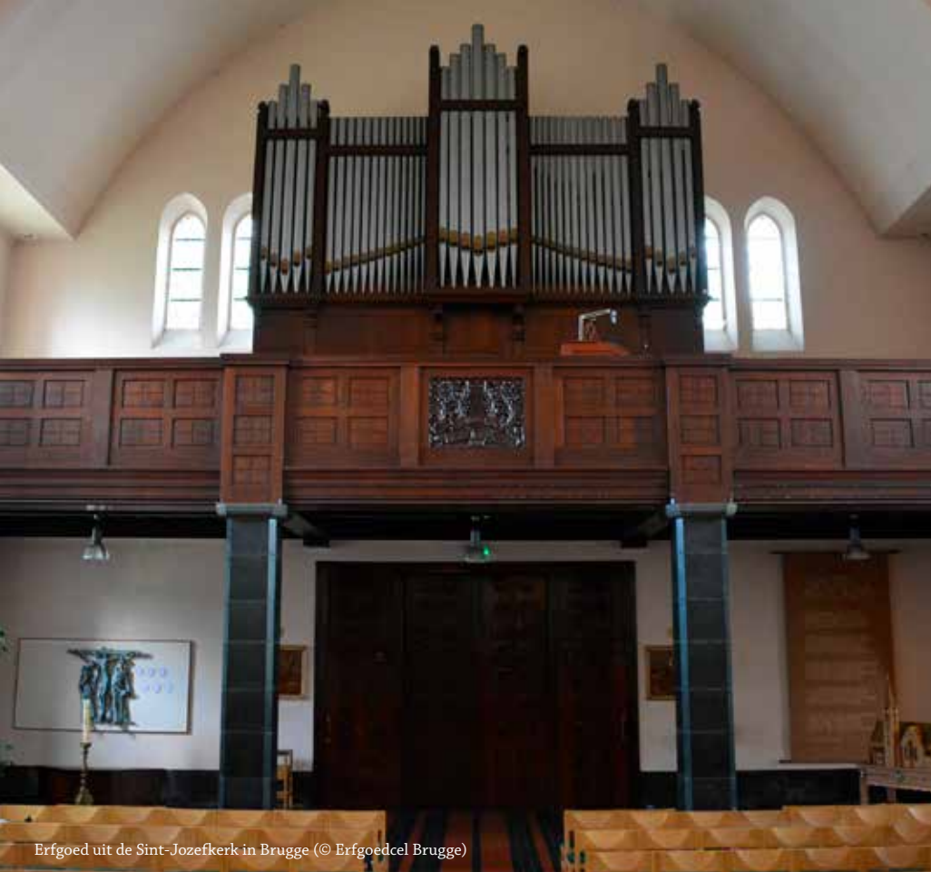
Erfgoed uit de Sint-Jozefkerk in Brugge