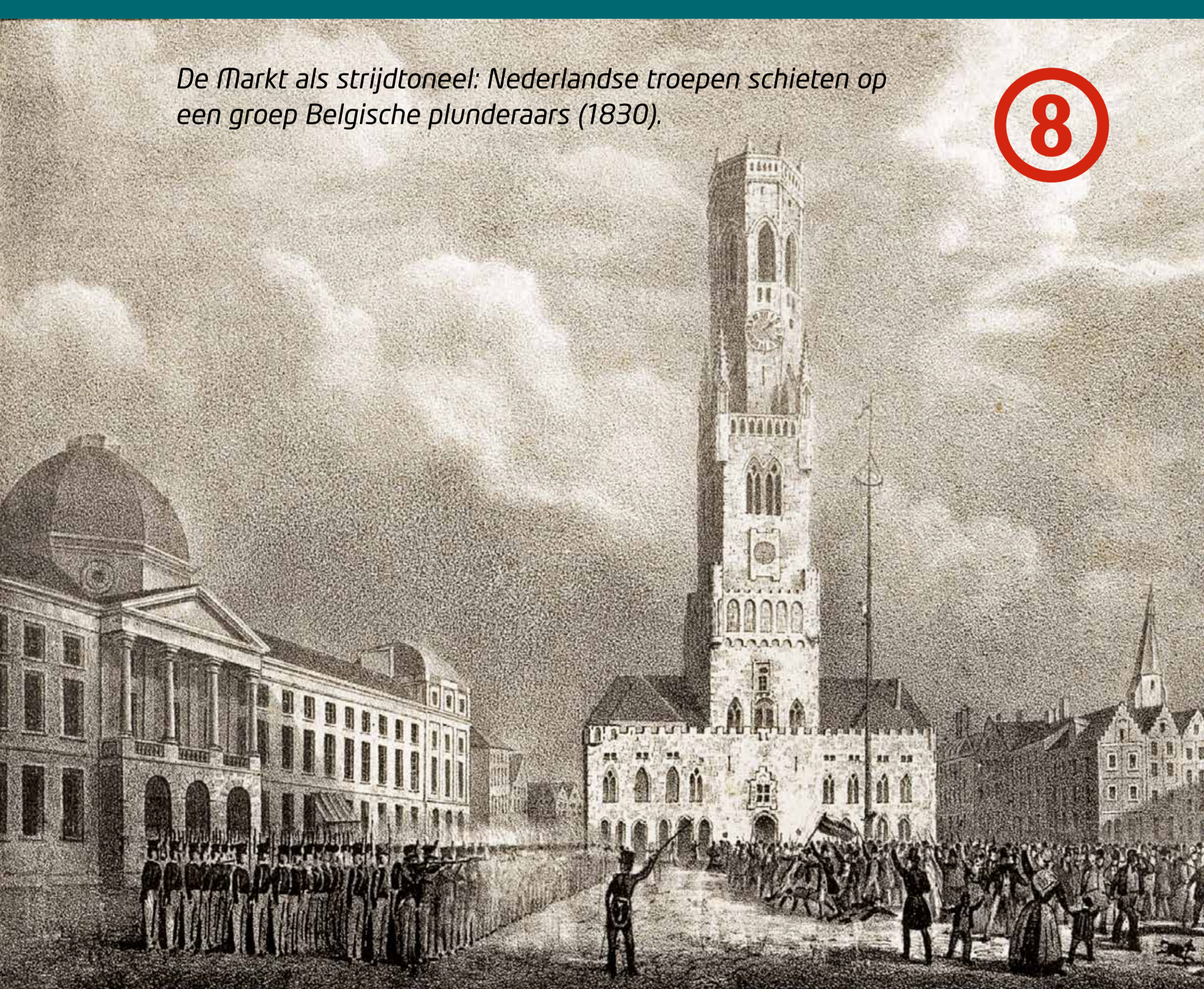
De Markt als strijdtonel: Nederlandse troepen schieten op een groep Belgische plunderaars (1830).

In 1488 wordt aartshertog Maximiliaan van Oostenrijk hier een tijd door opstandige Bruggelingen opgesloten.