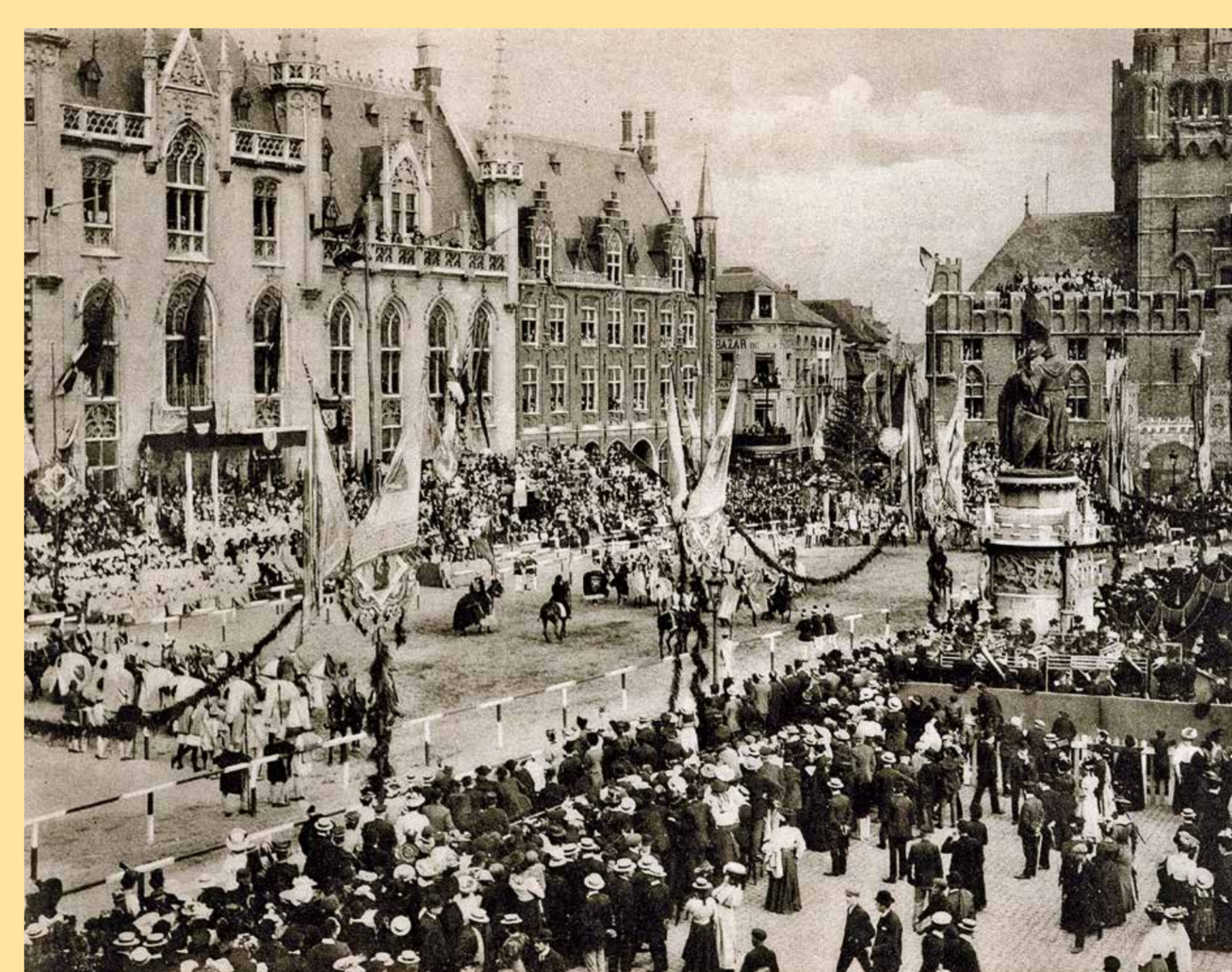
Feest op de Markt: toernooi van de Gouden Boom, begin 20ste eeuw