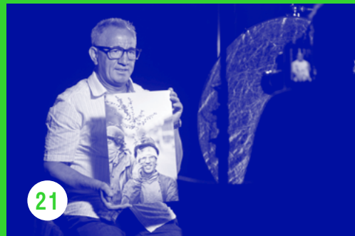
← © k.ERF